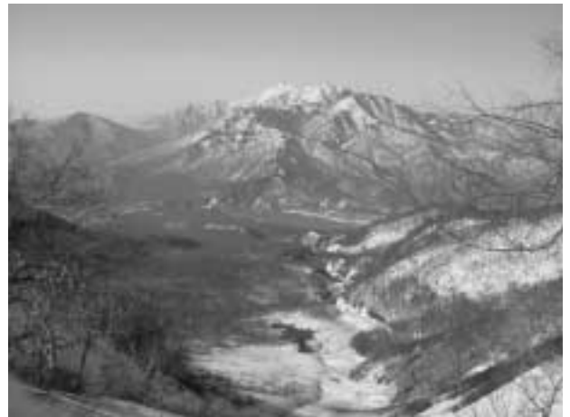
富士見平手前から乙妻山・高妻山を望む