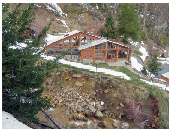
写真 10. ネバードス・デ・チジャン (9月1日)。室内温泉の建物。左がサウナ。右が屋外温泉。水着、スイミング・キャップ着用。