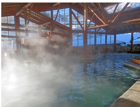
写真 12. 室内温泉 (9月3日)。湯気が立っているので温泉と判る。泉温は 40 度。