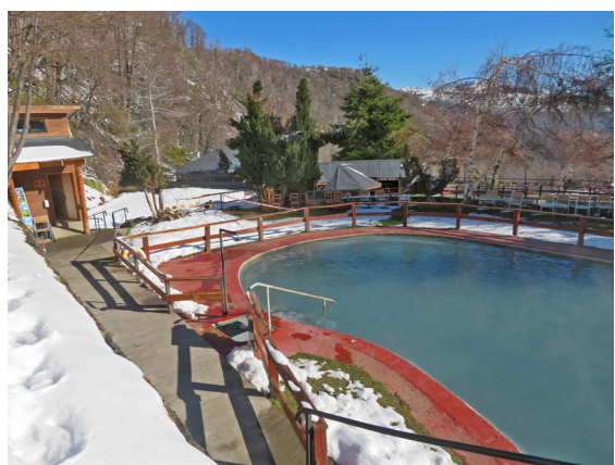
写真 11. 屋外温泉 (9月3日)。露天風呂と表現する雰囲気ではない。シャワーが付いている。これだけ見ていたら普通のホテルのプールと同じ。泉温は 39 度。ぬるい。