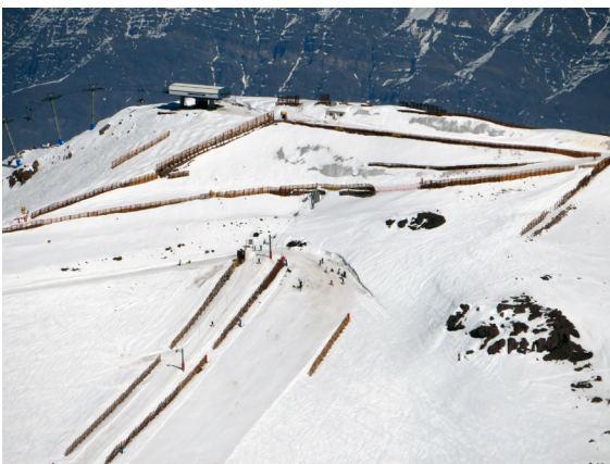
写真7. ヴァジェ・ネヴァードから隣のエル・コロラドを見下ろす(8月29日)。柵によって衝突を防いでいるのがよく分かる。

霧の中を1時半過ぎに出発したが、すでに解除を待つ車が何台も並んでいる。最後の車が上がってきて下りが動き出したのはなんと2時半過ぎ。