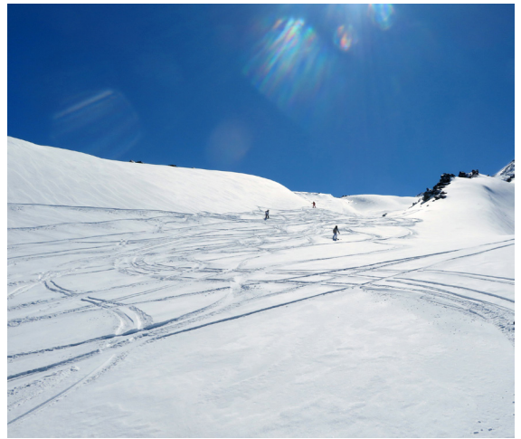
写真13. ネバードス・デ・チジャン（9月3日）。前日の新雪が積もったコース。広くて誰もいないので、皆思い思い好きなように滑った。

ホテル発9過ぎ。空港へは12時前に着いた。距離165kmをトイレ・ストップを入れて3時間。結構遠い。