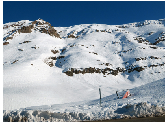
写真4. ヴァジェ・ネヴァードへ行く途中の斜面 (8月29日)。前の週に降った大雪の斜面を縦横無尽に滑っている。ヘリスキーだろうか。

ここにもスーパーシニアがあり、75才以上はタダ。支払うのはスキーパスの6,000ペソだけ。まずゴンドラとリフトを乗り継いで3300mまで行く。快晴で乾燥しており気持ちがいい。日本の秋みtainな空と空気である。奥にセロ・プロモ (Co Plomo 5424m) が見える (写真6)。