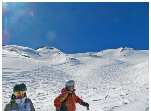
写真14. 新雪が積もった非整地斜面の中程からオットーリフトと上部非整地斜面を見上げる（9月3日）。