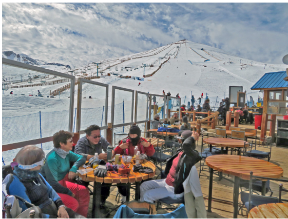
写真3. エル・コロラド (8月28日)。中腹のテラスでランチ。背景が円錐形の山 (3339 m)。コースが放射状にある。

昼食は自前のサンドウィッチを中腹のテラスで食べた。日差しが猛烈に強く、日に焼ける。が、雄大な景色と相まって気持ちがいい (写真3)。ゲレンデ・マップがないのでナビゲイトするのが難しい。12年前はあったが、今は HP からダウンロードするのだろう。ここは隣のラ・パルバにもヴァジェ・ネヴァードにもコースとリフトが繋がっているの、注意が必要である。下手すると戻って来れなくなる。