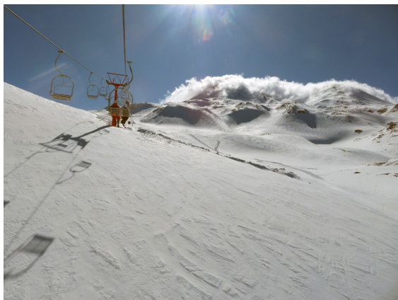
写真 8. ネバードス・デ・チジャン (9月1日)。アンデス・チジャン火山 (活火山) の山頂付近 (~3100m) の強風。