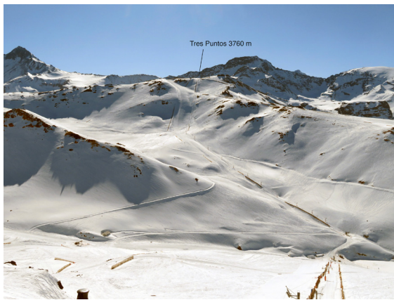
写真5. ヴァジェ・ネヴァード (8月29日)。スキー場の最高点 Tres Puntos 3670m を見る。この広大なエリアに誰も写っていない! ここへ行くのは T-bar lift。右へ曲がって急傾斜。雪が良ければ何処でも滑れるが、すでに硬くなっていた。