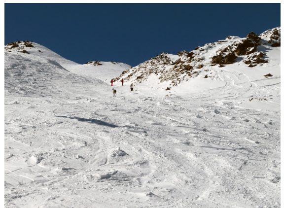
写真15. 非整地斜面で苦労する仲間（9月3日）。午前中に来ていたら新雪斜面を滑れた。