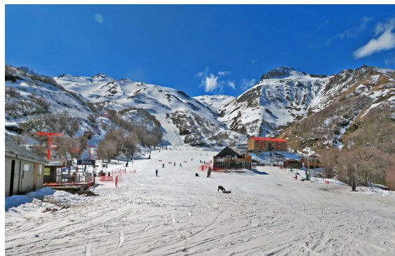
写真 9. ネバードス・デ・チジャンの主なエリア (9月1日)。右の赤い屋根の建物がホテル。谷の左側がリフトで行ける範囲。右側はキャットスキーのみ。Otto lift は長さ 2172m で最長。20分以上かかる！