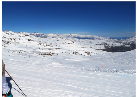
写真 2. ラ・パルバ (8月27日)。見渡す限り、コース。広い! 何処でも自由に滑れる。