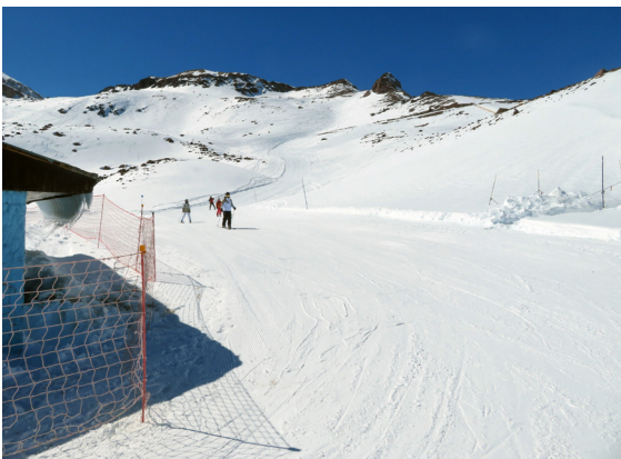
写真 1. ラ・パルバ (8月27日)。誰もいない広い斜面を気持ちよく滑るメンバー!