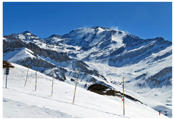
写真6. ヴァジェ・ネヴァードからセロ・プロモ (5424m) を見る (8月29日)。