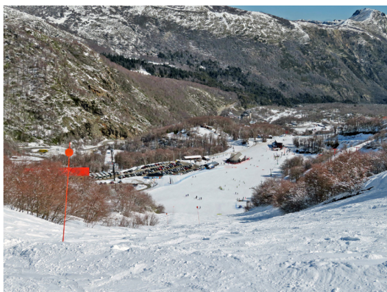
写真 16. ネバードス・デ・チジャン (9月3日)。上部からピギナーエリアを見下ろす。

例によってスキー3台を一つに束ねて、2つの Excess にする。ここではラップしろと言われぬ。さらに何かの手違いかどうか判らないが、なんと無料であった。うれしい誤算。来る時、必要がないのにラップしろと言われて余計な出費があったので、嬉しい。